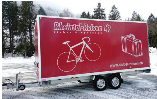
Velo- oder Gepäckanhänger für Car