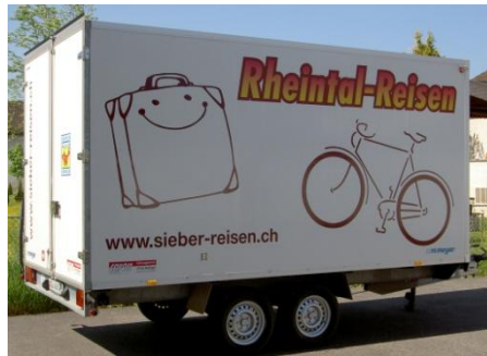
Platz für viel Gepäck oder für 40 Velos!