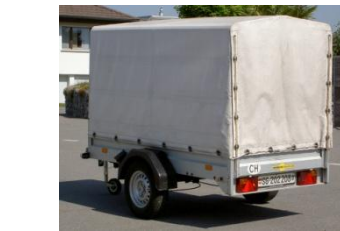
Gepäckanhänger für Midi- und Kleinbus