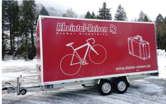
Velo- oder Gepäckanhänger für Car