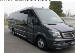
16-Pl. / Euro 6