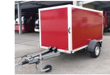
Gepäckanhänger für Midi- und Kleinbus