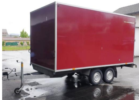
Platz für viel Gepäck oder für 40 Velos!