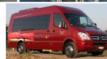
19-Pl. / Euro 5 EEV

Busvermietung: (für private Nutzung oder für Vereine)