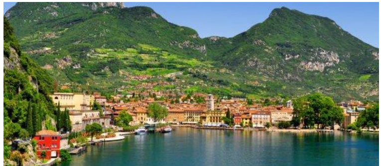
Gardasee – Riva del Garda

Das Südtirol ist ein Schmelztiegel der Kulturen und Gegensätze. Deutsche, Italiener und Ladinier leben hier mit- und nebeneinander. Alpine und mediterrane Lebensart, aber auch Bräuche und Gewohnheiten verflechten zusehends und werden zu Neuem verknüpft. Auch die heterogene Landschaft trägt zum Lebensgefühl im Südtirol Urlaub bei. Von der schönsten Freilichtbühne der Alpen – den Südtiroler Dolomiten, die wegen ihrer einzigartigen Schönheit von der UNESCO zum Weltkulturerbe gekrönt worden sind, ganz zu schweigen.