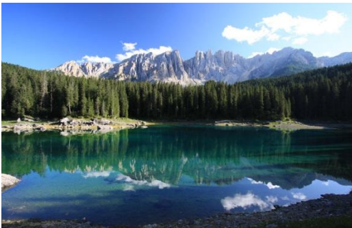
Karrersee mit den Bergen des Rosengarten

Montag, 08. Oktober 2018 – Donnerstag, 11. Oktober 2018 4 Tage